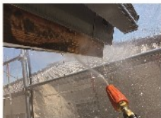
鼻隠し 高圧洗浄 木部のアクが落ちている