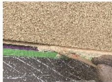
外壁 窓回りや軒天との取 り合いの細部は刷毛塗り