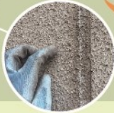
板間のシーリングの塗料が剥げ、 粉が手につく状態でした。