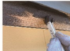
鼻隠し 木部塗装 木材保護塗料塗り