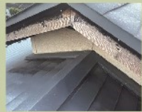
破風木部が黒ずみ、 金属屋根の色が褪せ 汚れが目立っていました。