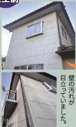
壁の汚れが 目立っていました。